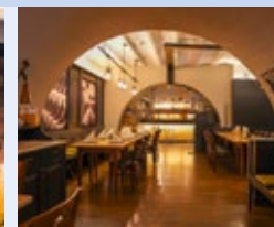
Abendessen im Proviandamt Mainz